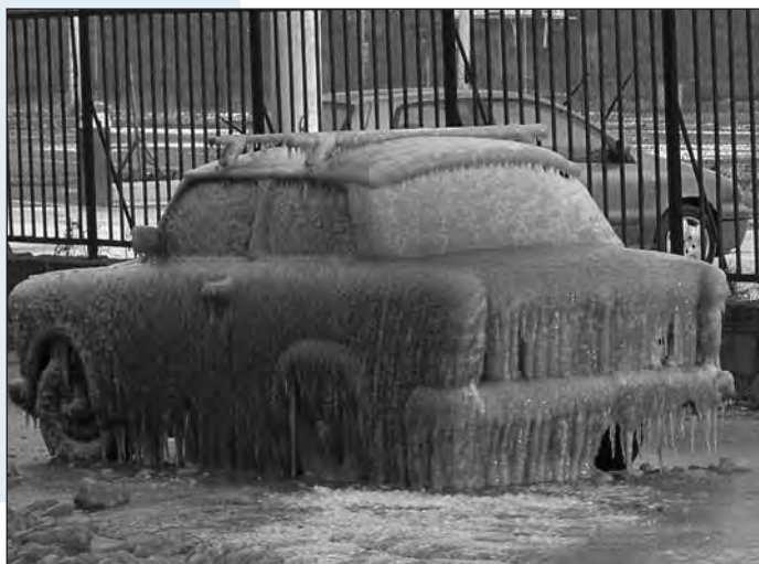
86 procent van de klassiekers wordt in een garage gestald en komt 's winters nauwelijks buiten: dat geldt voor deze Trabant kennelijk niet....